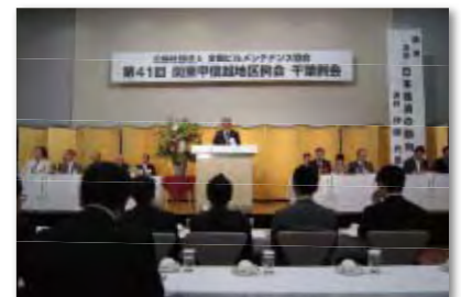
▲関東甲信越地区例会 千葉例会