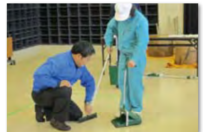
▲養護学校向けビルクリ学習指導