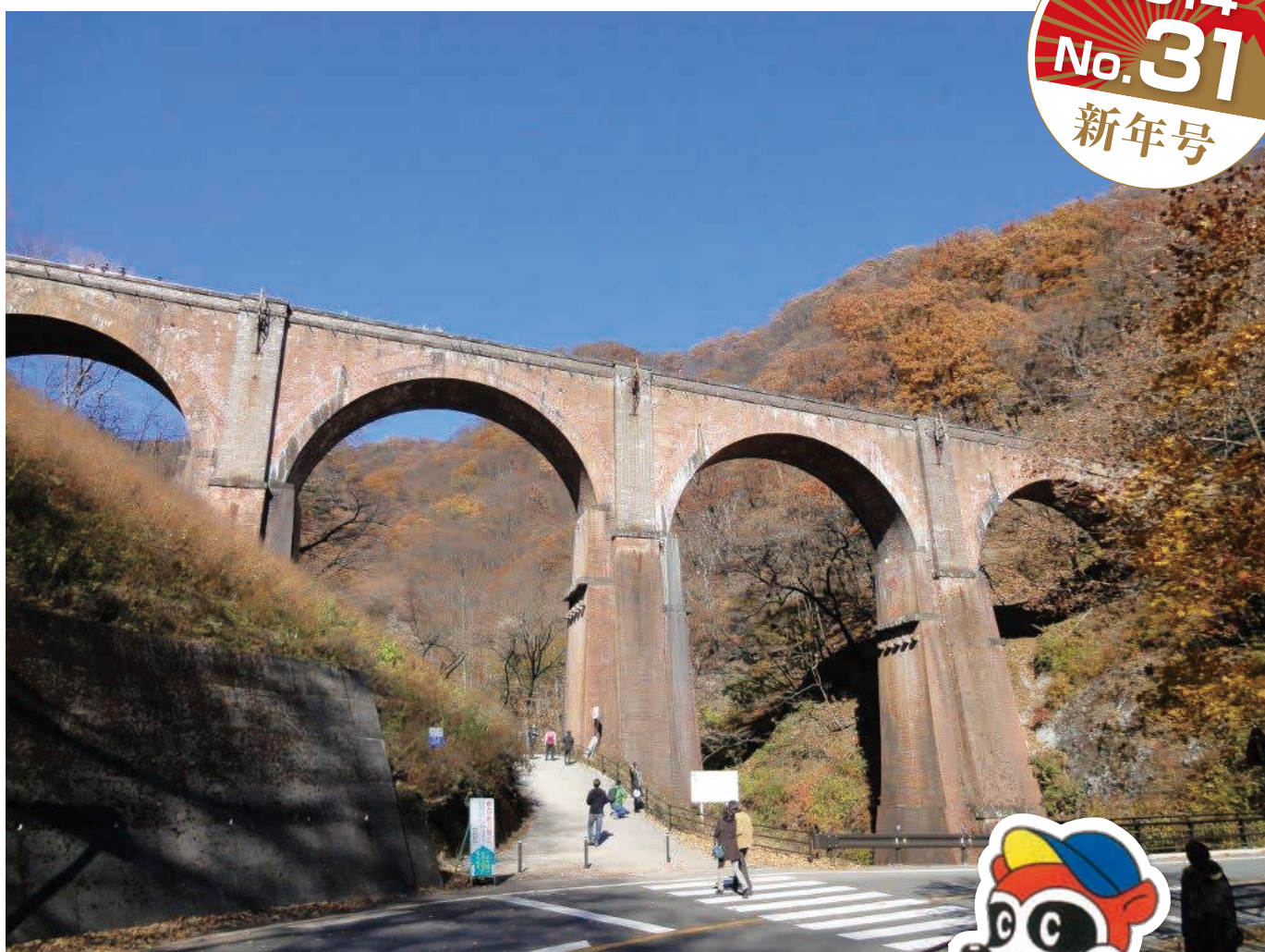
「碓氷峠のめがね橋」