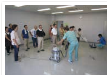
オフィスクリーニング講習