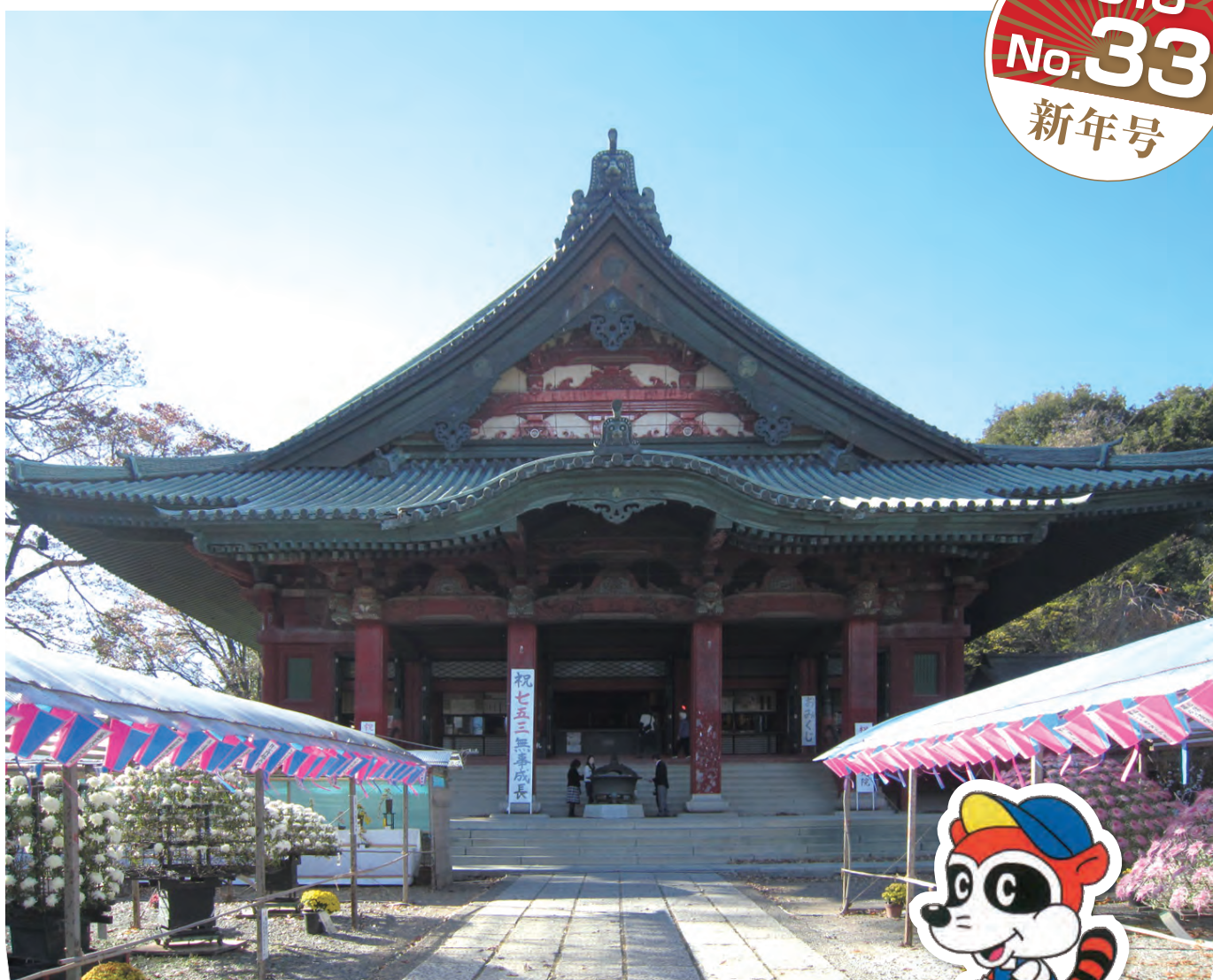
「太田市大光院」