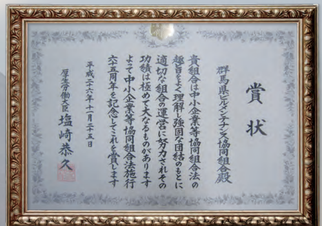
厚生労働大臣表彰

いずれにしても厳しい状況がつづくことには変わりありませんので、会員の皆様には互いに団結し、必要とあれば、知恵を出し合い、JVを組んででも、物件の確保に転換する覚悟が必要な気がいたします。どうか、本年も協同組合活動に一層のご支援をお願い致します。