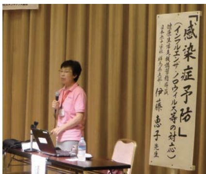
特別講演「感染症予防(インフルエンザ・ノロウイルス等の対応)」