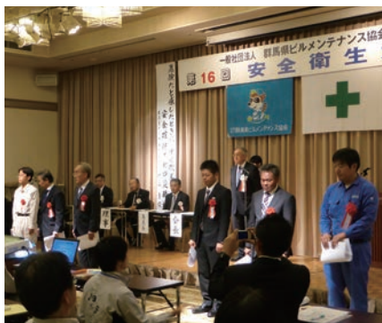
優良安全衛生管理者表彰