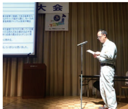
ヒヤリハット体験事例発表