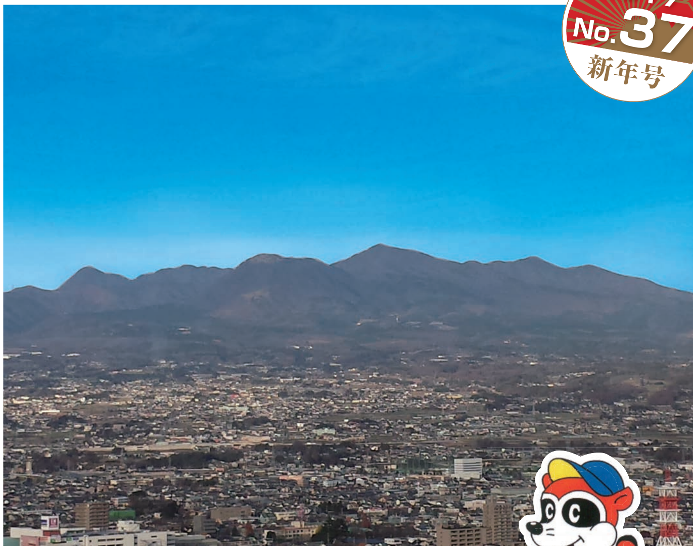
「裾野は長し 赤城山」