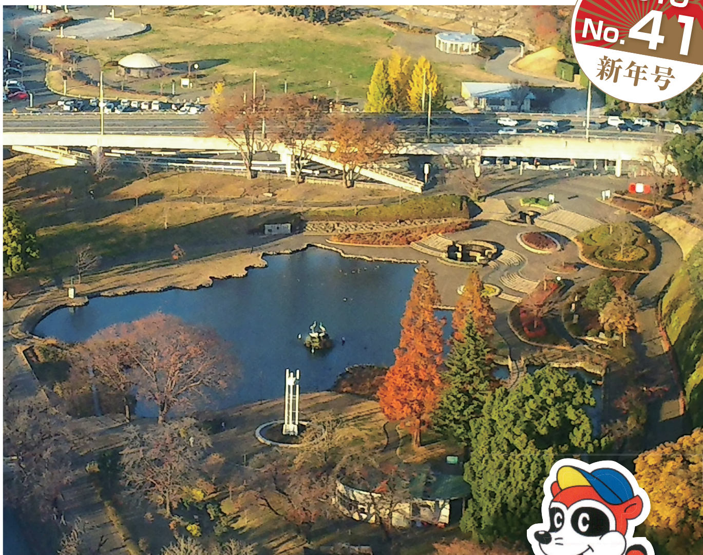
前橋公園内にある「さちの池」は群馬県の形(つる舞う形)をしています。