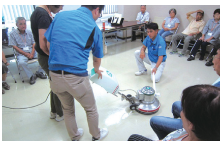
シニアワークプログラム事業