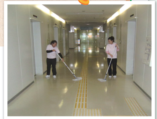
群馬県庁舎で実習する2人

それぞれが、会員各社の戦力となり、懸命に実習している姿を目の当たりにして、是非、我がビルメンテナンス業界を学び、将来、戦力の中枢になってほしいし、母国でもチャンスがあれば、技能を発揮し、広めてもらいたいと願います。