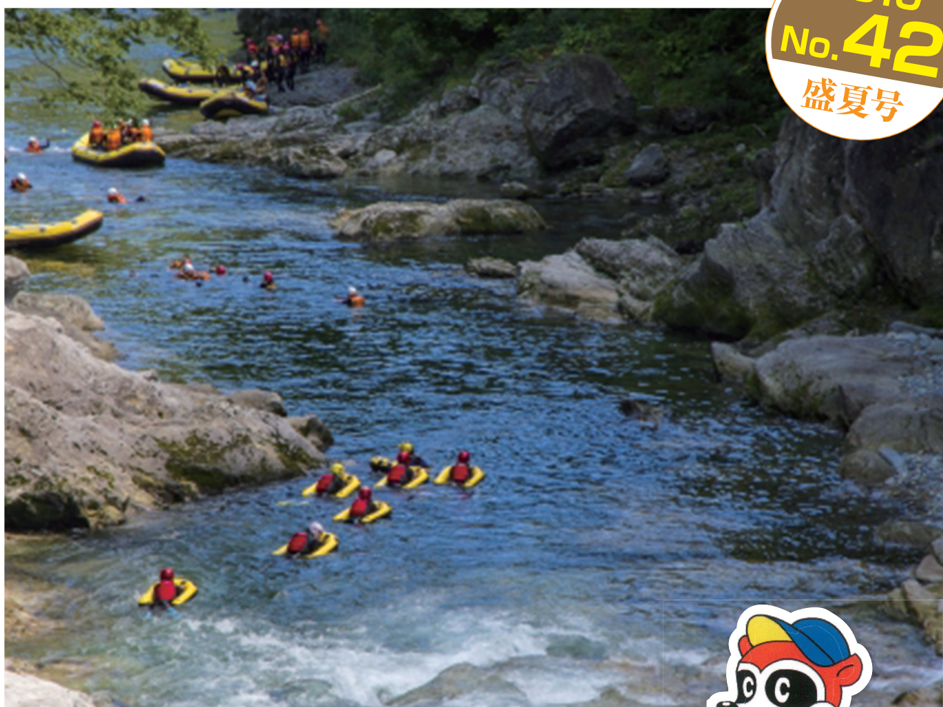
「利根川上流のアクティビティ」