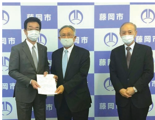
藤岡新井雅博市長