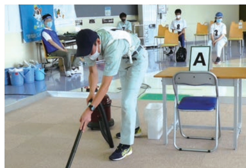
ぐんまアビリンピック2020