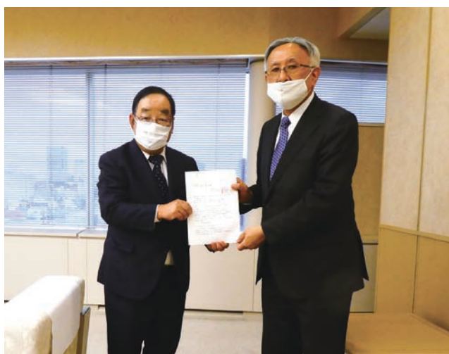
高崎富岡賢治市長