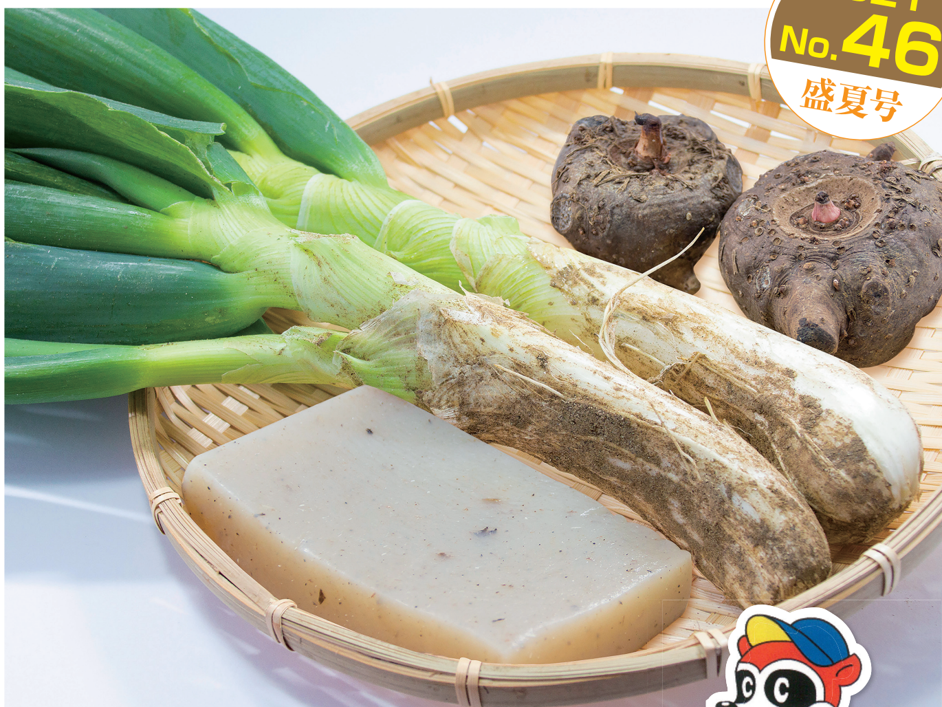
「ねぎとこんにゃく 下仁田名産」