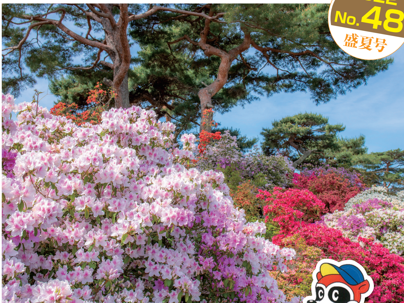
「花山公園 つつじの名所」