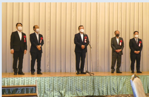
挨拶をされる支援県議団の皆さん